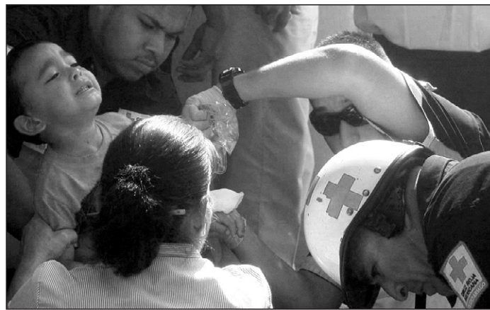
Von den insgesamt 176 Kindern überlebten 138.

Die meisten Todesopfer waren zwischen drei Monate und zwei Jahre alt. Sie erstickten, verbrannten bei lebendigem Leib oder wurden vom einstürzenden Dach erschlagen. Laut örtlichen Medienberichten befanden sich zu dem Zeitpunkt 176